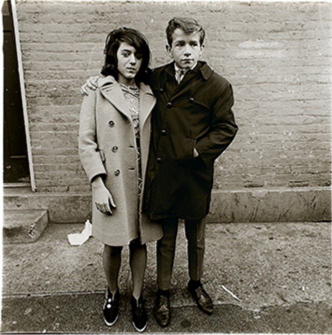
Diane Arbus, Teenage couple on Hudson Street, N.Y.C., 1963