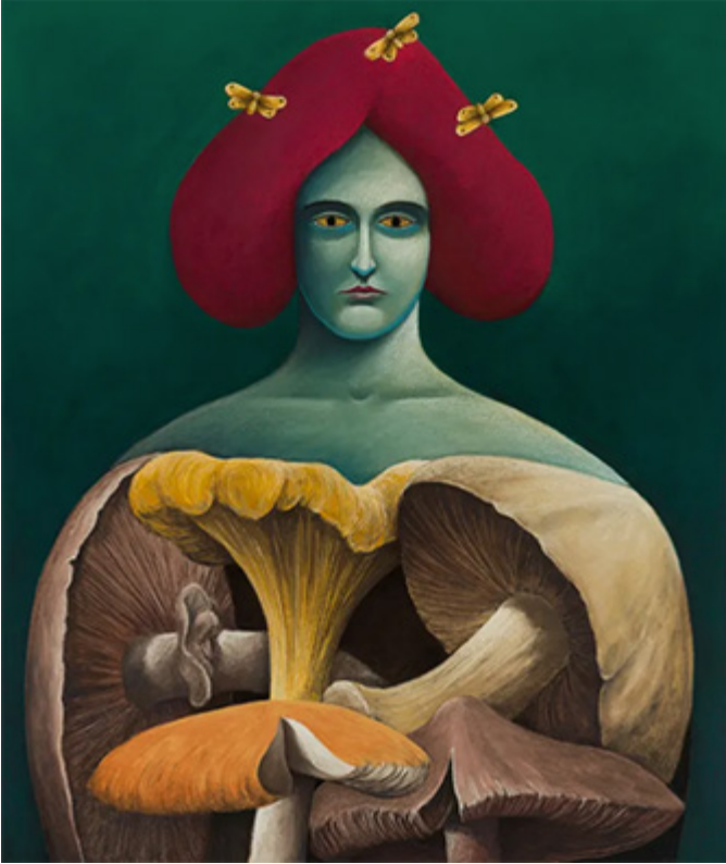
Nicolas Party, Portrait avec champignons, 2019

Considéré comme l'un des chefs de file de sa génération, Nicolas Party est reconnu pour ses œuvres au pastel qui revisitent les genres classiques de la peinture et pour ses installations immersives qui font foi d'une vaste érudition artistique.