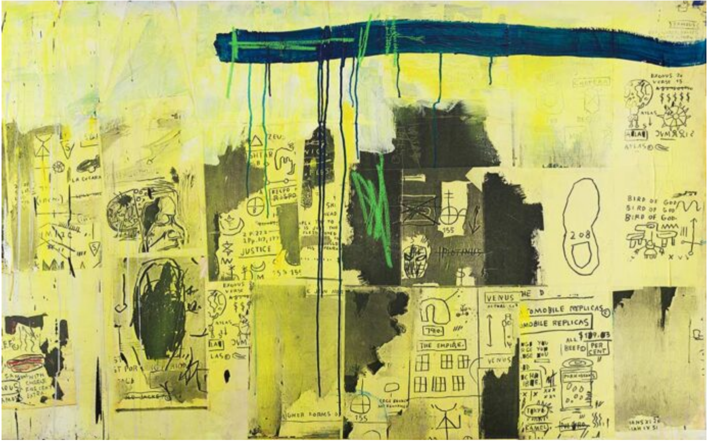
Jean-Michel Basquiat, Kokosolo, 1983

Composée de tableaux, de dessins, d'extraits sonores, de films et de nombreux documents d'archives, l'exposition immergera les visiteurs dans le New York des années 1970 et 1980. Elle étudiera ses liens avec le milieu de la musique et les inspirations musicales – allant du jazz au hip-hop – qui ont façonné l'œuvre de Basquiat, à la fois artiste, mélomane et musicien.