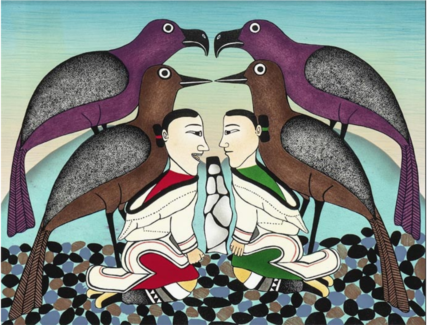
Kenojuak Ashevak, Guardians of Katajaniq, 1992

Entrecroisant anthropologie et histoire de l'art autochtone, cette exposition offrira un panorama étudié d'œuvres contemporaines et traditionnelles des régions circumpolaires – sculptures, gravures, dessins et installations – qui illustrent l'expression musicale inuit sous toutes ses formes.