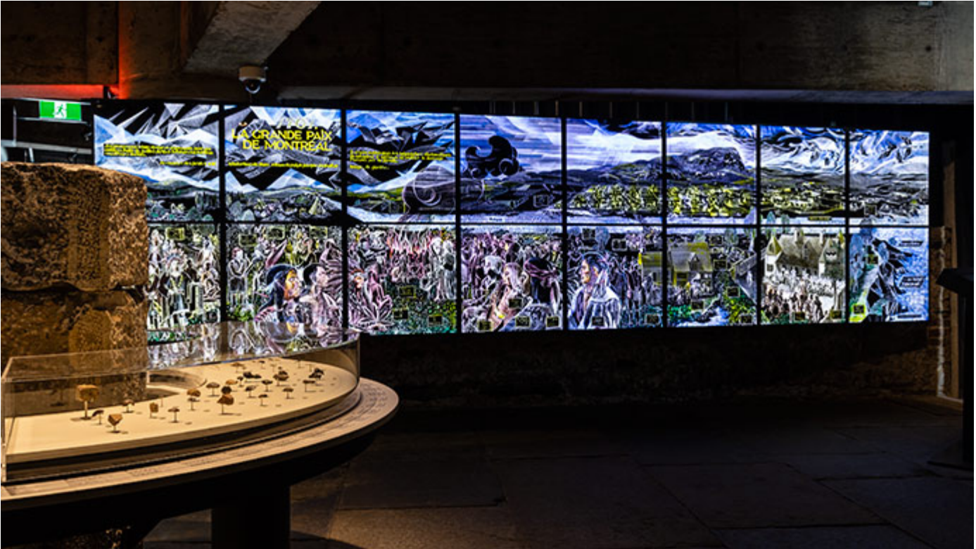
Pointe-à-Callière, Cité d'archéologie et d'histoire de Montréal

Reconnue comme un lieu de mémoire, Pointe-à-Callière est aujourd'hui le seul musée d'archéologie d'envergure au Canada, mais aussi le musée d'histoire le plus fréquenté à Montréal : plus de 10 millions de visiteurs ont franchi ses portes depuis sa création. Cœur battant du Vieux-Montréal, il offre toute l'année de nombreuses activités culturelles gratuites, citoyennes et familiales, comme en témoigne la programmation des 30 ans.