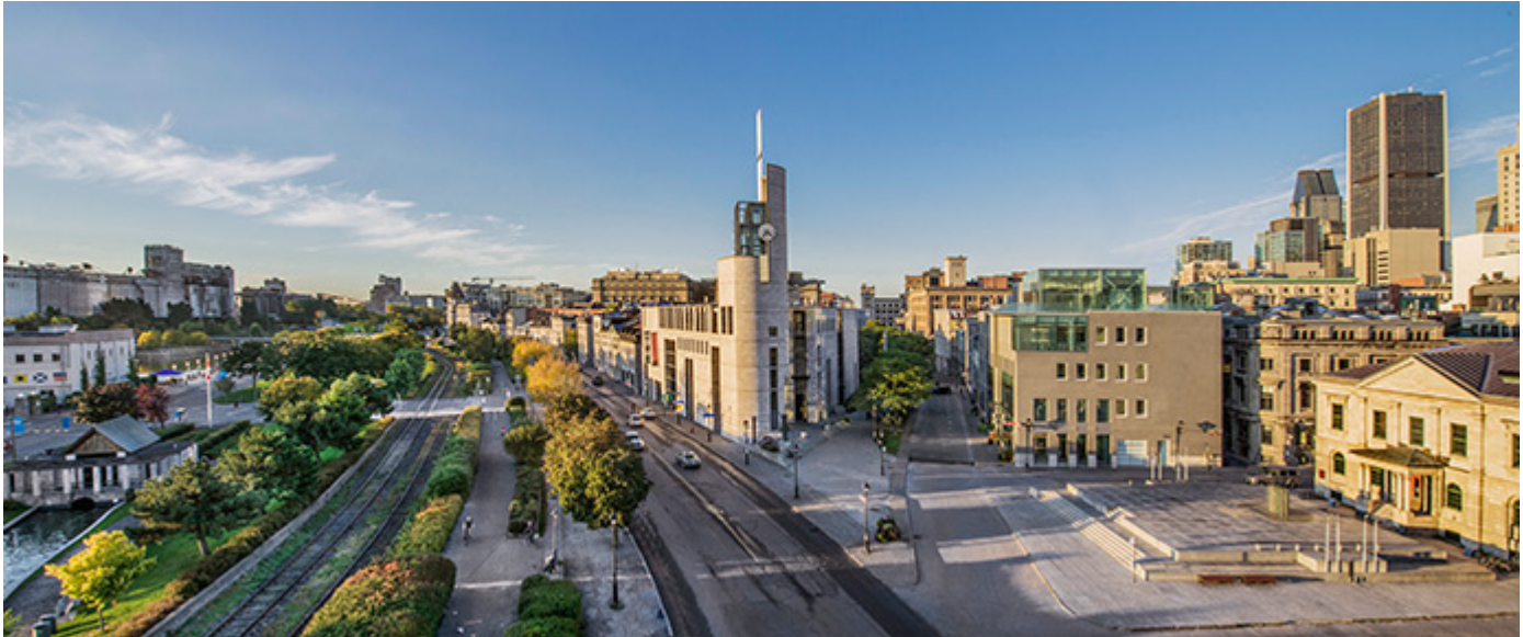
Pointe-à-Callière, Cité d'archéologie et d'histoire de Montréal