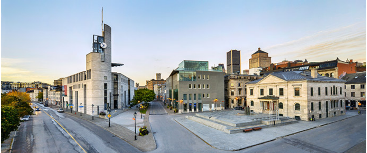
Pointe-à-Callière, Cité d'archéologie et d'histoire de Montréal