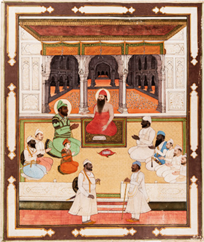
Le maharaja Karam Singh de Patiala et son fils Narinder Singh en compagnie d'un saint homme, 19e s., gouache, encre à la poudre d'or et encre sur carton

Cette collection comprend de remarquables œuvres sur papier illustrant les 10 gourous, de resplendissantes enluminures représentant les maharajas les plus connus de l'Empire sikh (1799-1849), de même que des objets rituels et de rares pièces de monnaie (nanakshahi) datant de cette grande période d'effervescence artistique. Des textes poignants sur les sikhs de l'époque du Raj britannique (1858-1947) donnent lieu à une mise en contexte de l'exotisme d'alors et ouvrent la discussion sur le sujet. La collection compte également plusieurs châles (phulkari) qui témoignent de l'importance de la tradition textile au Pendjab.