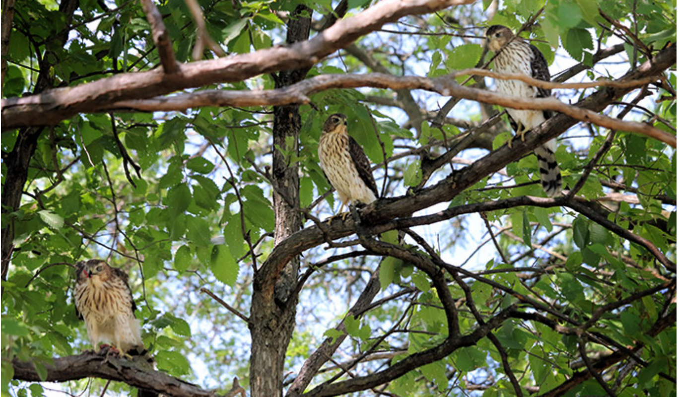
Trois jeunes Éperviers de Cooper

Image d'entête : Jeune Épervier de Cooper