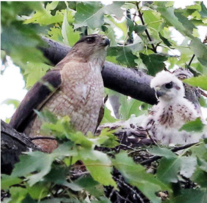
Maman Épervier de Cooper avec son petit

Durant cette période, j'ai pu obtenir de très belles photos des parents qui se sont gentiment perchés sur les branches inférieures. Une fois le nid terminé, la femelle s'est installée et y passa presque tout son temps. Au début de juin, j'ai pu voir la première petite tête blanche et pelucheuse d'un oisillon.