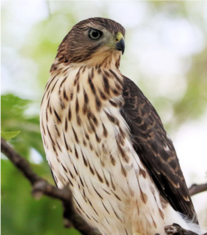
Portrait d'un jeune Épervier de Cooper