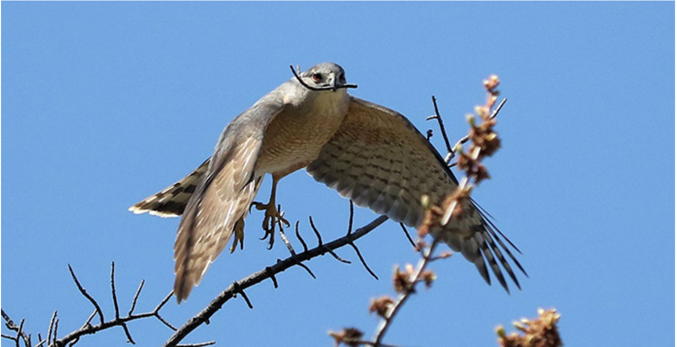
Épervier de Cooper mâle rassemblant des brindilles pour le nid

Durant cette période, j'ai pu obtenir de très belles photos des parents qui se sont gentiment perchés sur les branches inférieures. Une fois le nid terminé, la femelle s'est installée et y passa presque tout son temps. Au début de juin, j'ai pu voir la première petite tête blanche et pelucheuse d'un oisillon.