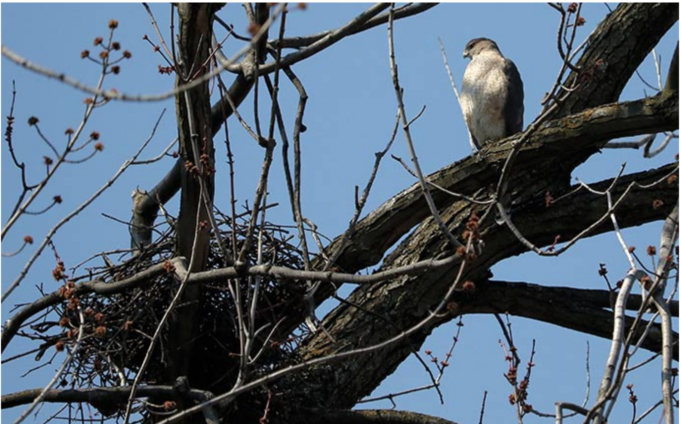
Épervier de Cooper près de son nid