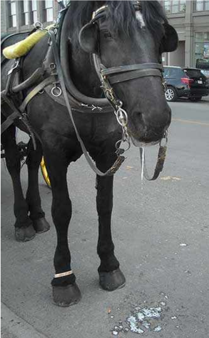
Cheval de calèche présentant des signes de maladie

Les autorités furent tenues sur un pied d'alerte avec des photos et des vidéos d'infractions quotidiennes et d'abus de chevaux rendues virales sur les réseaux sociaux, et que les campagnes de courriels et de plaintes à la ville et à la MAPAQ rendaient persistantes.