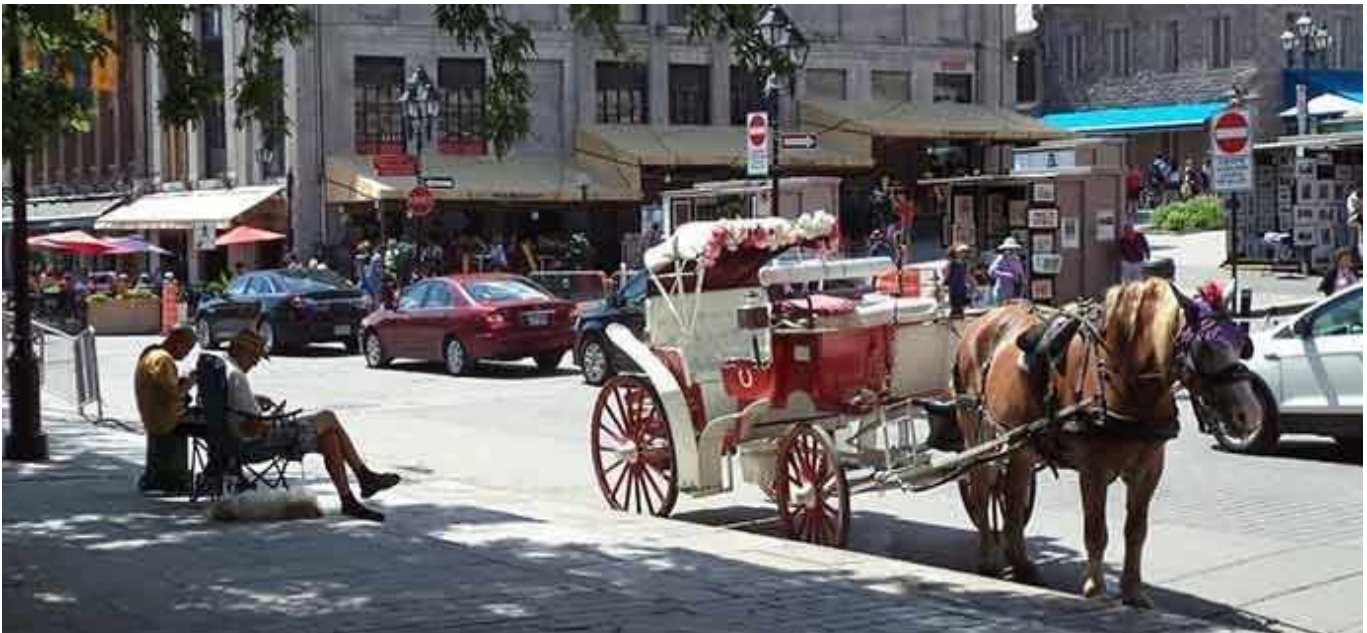
Cheval de calèche attendant sous un soleil accablant pendant que le cocher profite de l'ombre.

Aujourd'hui, en 2019, les calèches sont perçues comme des reliques d'un temps où les animaux étaient des commodités. L'administration présente de la ville, dirigée par la mairesse Plante, a voté unanimement le bannissement des calèches en août 2018 et a offert de racheter les chevaux au coût de 1000$ chacun. La ville travaillera par la suite avec les sanctuaires et les organisations locales pour placer les chevaux dans des foyers sécuritaires et permanents. Ce plan les sauvera de l'abattoir au cas où les propriétaires décideraient de se débarrasser d'eux.