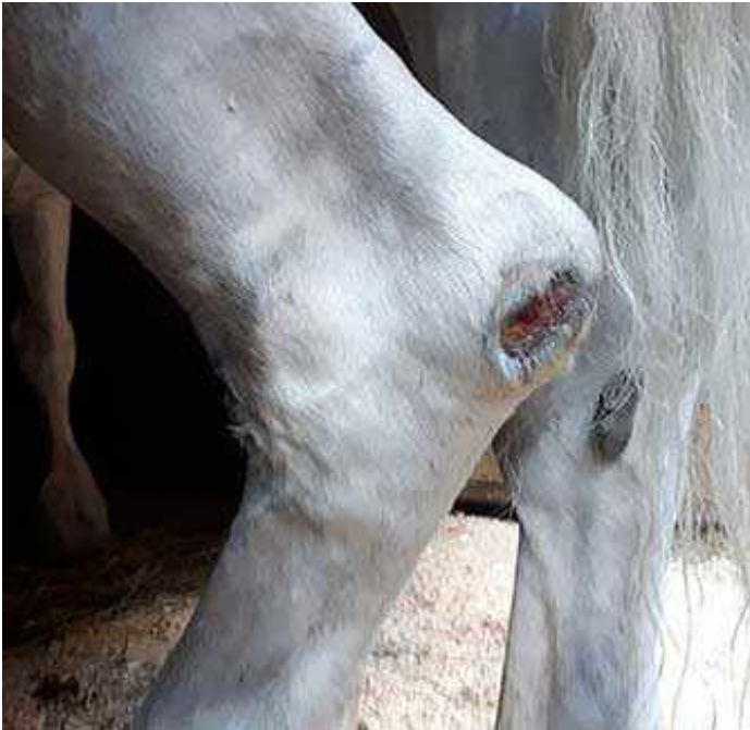
Blessure à la jambe d'un cheval de calèche

imminente. Mais, ensemble, nous pouvons nous assurer que les règlements administratifs sont appliqués.'