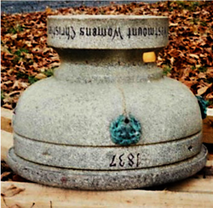
Partie de la fontaine manquante désassemblée

Apparemment, dans les années 1960, il y a eu un réaménagement majeur du parc au cours duquel la fontaine a été, pour des raisons inconnues, désassemblée et enlevée. Fait intéressant, les archives de la ville possèdent un document avec des photographies datant de 1987 qui montrent la fontaine démontée, à 100 kilomètres au nord de Montréal, à Saint-Gabriel-de-Brandon. La question est de savoir comment la fontaine s'est retrouvée là. On peut supposer qu'elle a été donnée à un employé de la Ville qui l'a déplacée sur une propriété de campagne.