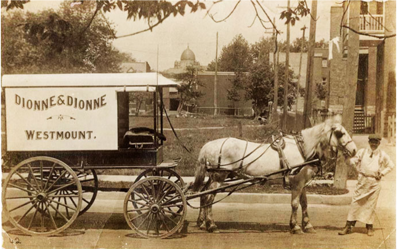
Charrette tirée par des chevaux de Dionne et Dionne