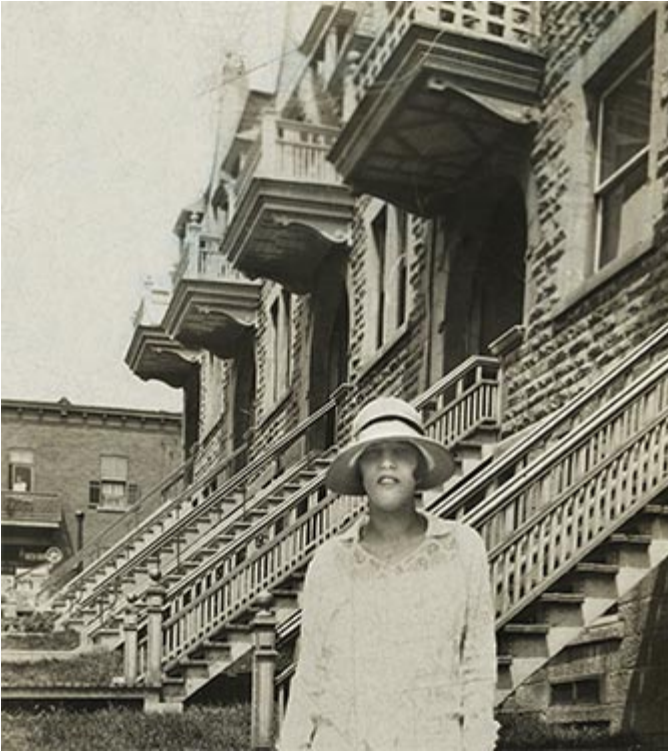
L'avenue Brooke vers 1924

Il est intéressant de noter que la rue était initialement un prolongement de l' avenue Clandeboye et portait ce nom jusqu'en 1897. Aujourd'hui, la rue Clandeboye se termine à la rue Prospect.