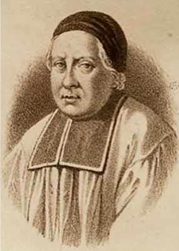
François Vachon de Belmont (circa 1700) – Domaine public

En me promenant dans la rue, je me souviens du conte des frères Grimm, Hansel et Gretel, de 1812, et de leur découverte d'un chalet construit en pain d'épices.