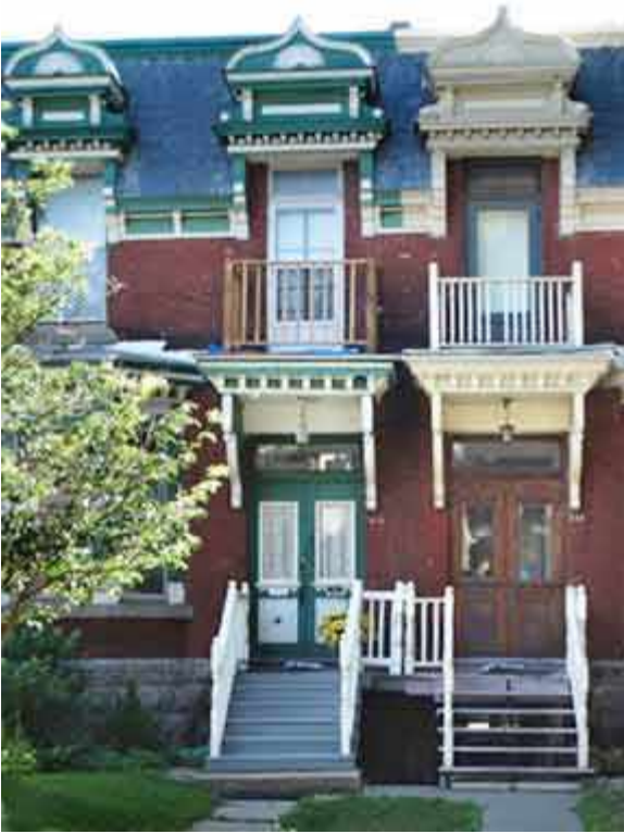
110 Place Blenheim