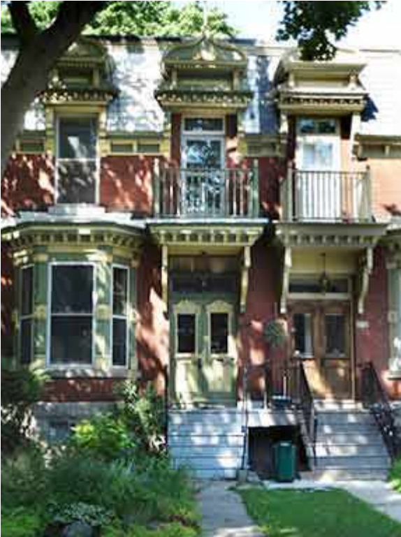
115 Place Blenheim