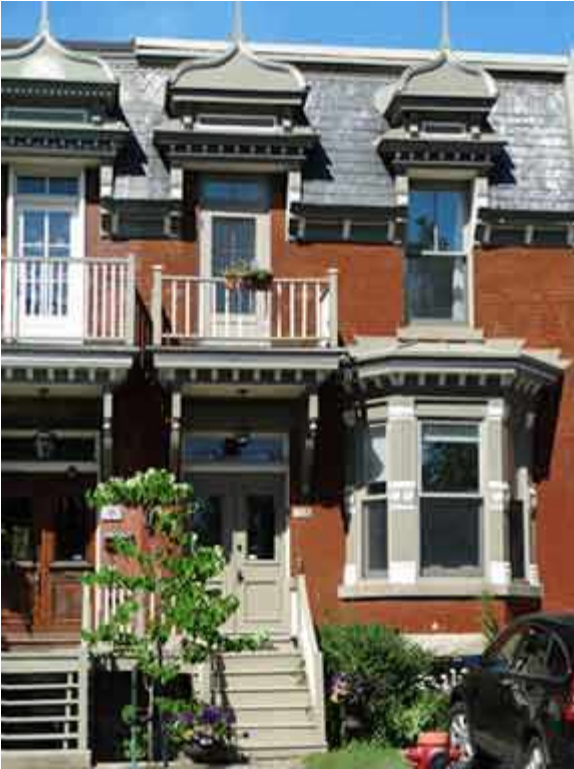
105 Place Blenheim

« La bataille de Blenheim fut livrée le 13 août 1704 pendant la guerre de Succession d'Espagne (1702-13). Défaite décisive des forces franco-bavaroises par les armées alliées anglaises, néerlandaises et autrichiennes, elle a détruit le mythe de l'invincibilité française et a valu à l'armée britannique une réputation durable de courage et de discipline sur le champ de bataille. »