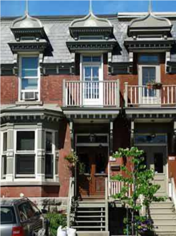
107 Place Blenheim