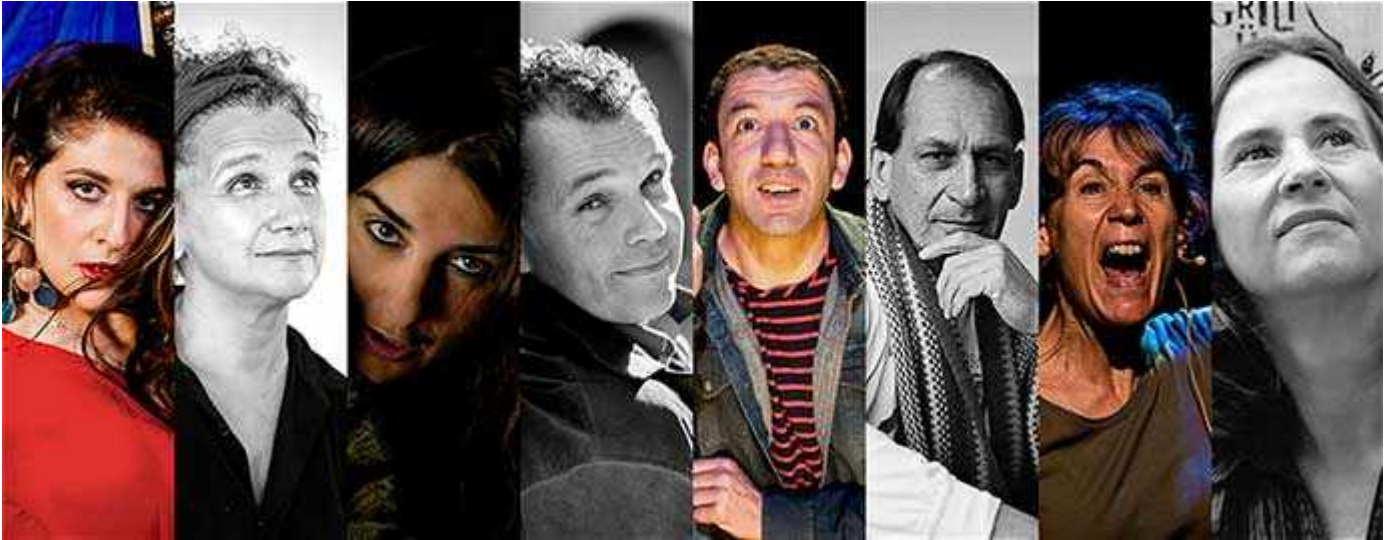
Festival du conte 2019