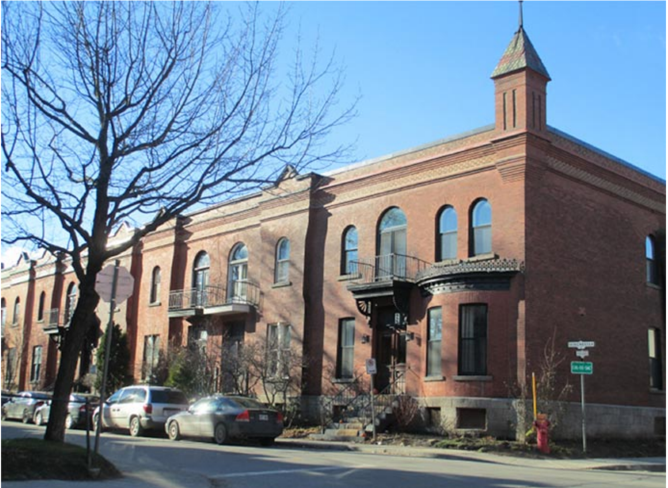
1 et 3 Winchester

Comme on peut le voir, le nom de la rue renferme une mosaïque de récits, dont certains font maintenant partie de nos vies. Faisons donc une promenade le long de Winchester Avenue et découvrons quelques-unes des anecdotes oubliées depuis longtemps qui se cachent derrière les résidences qui ornent cette rue.