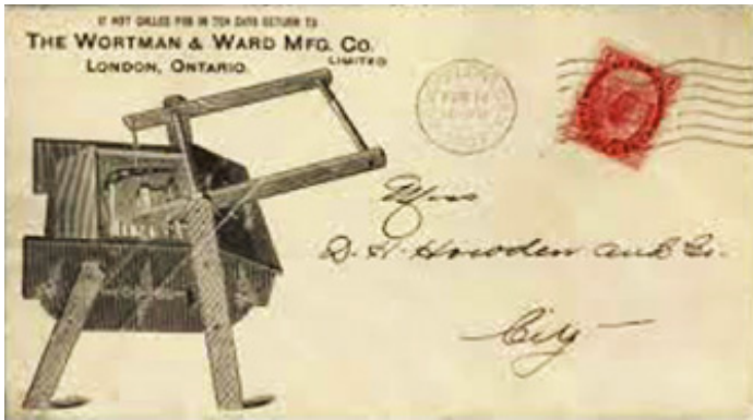
Carte postale Wortman & Ward Manufacturing