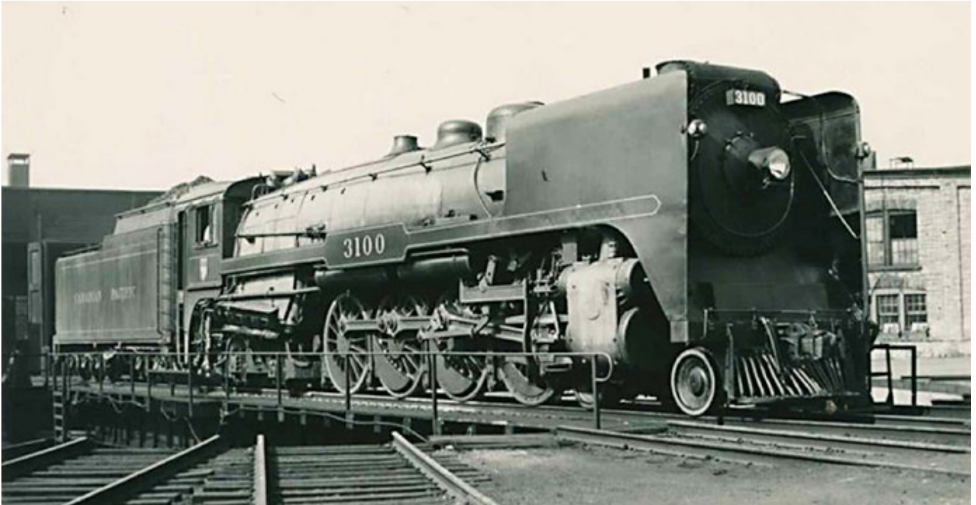
Locomotive "3100" à Glen Yards (1948)