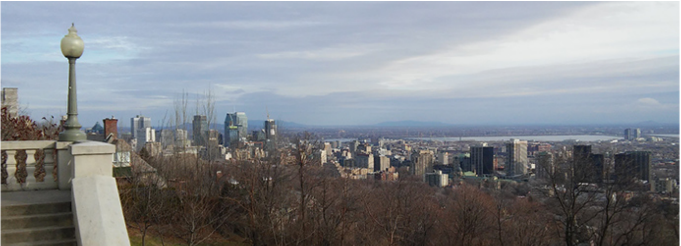
Mirador de Summit Circle au-dessus du parc Sunnyside, vue vers l'est.

Cette splendide région est composée de schiste d'Utica, une roche sédimentaire noire qui se brise généralement en minces morceaux plats, et de calcaire de Trenton contenant des fragments de fossiles. Dans les zones plus profondes, le calcaire forme un marbre blanc. Dans les puits de pétrole, le ce type de roche produit du gaz naturel et du pétrole brut.