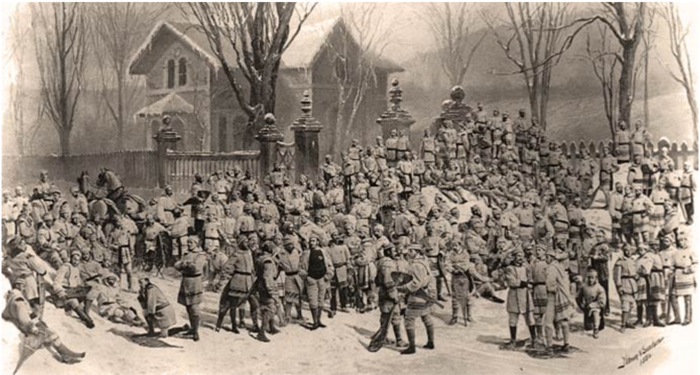
Le club de raquette St-Georges Snowshoe Club aux portes de McGill, Montréal 1880