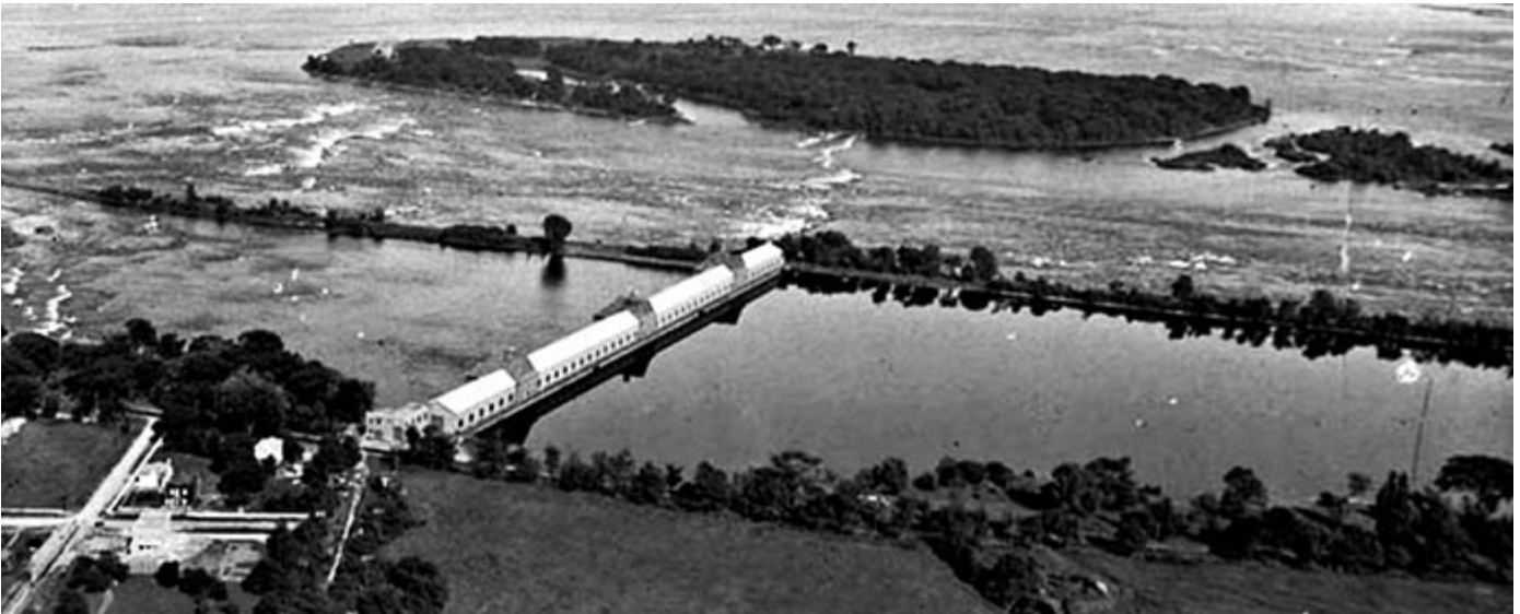
Le barrage hydroélectrique de Lachine • Image : Ministère des Terres et Forêts, domaine public, via Wikimedia Commons