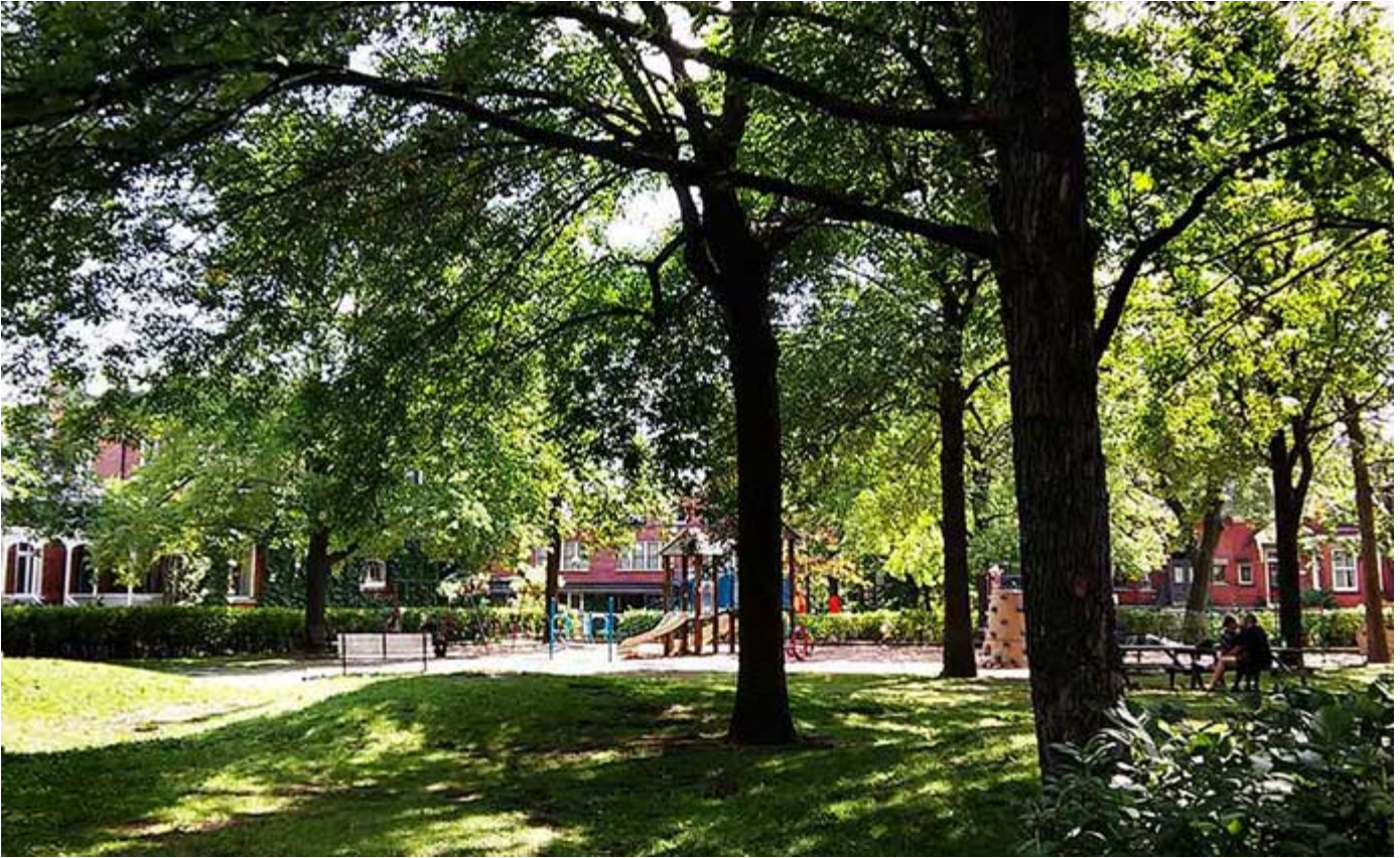
Parc Stayner • Image: Andrew Burlone