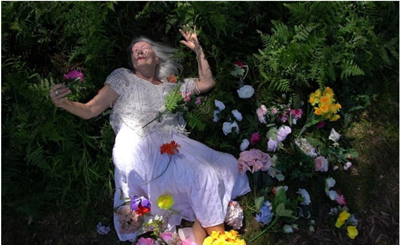
Lady of the Horizon, de Sue Healey

Disponible en ligne dès le 22 juillet 2022