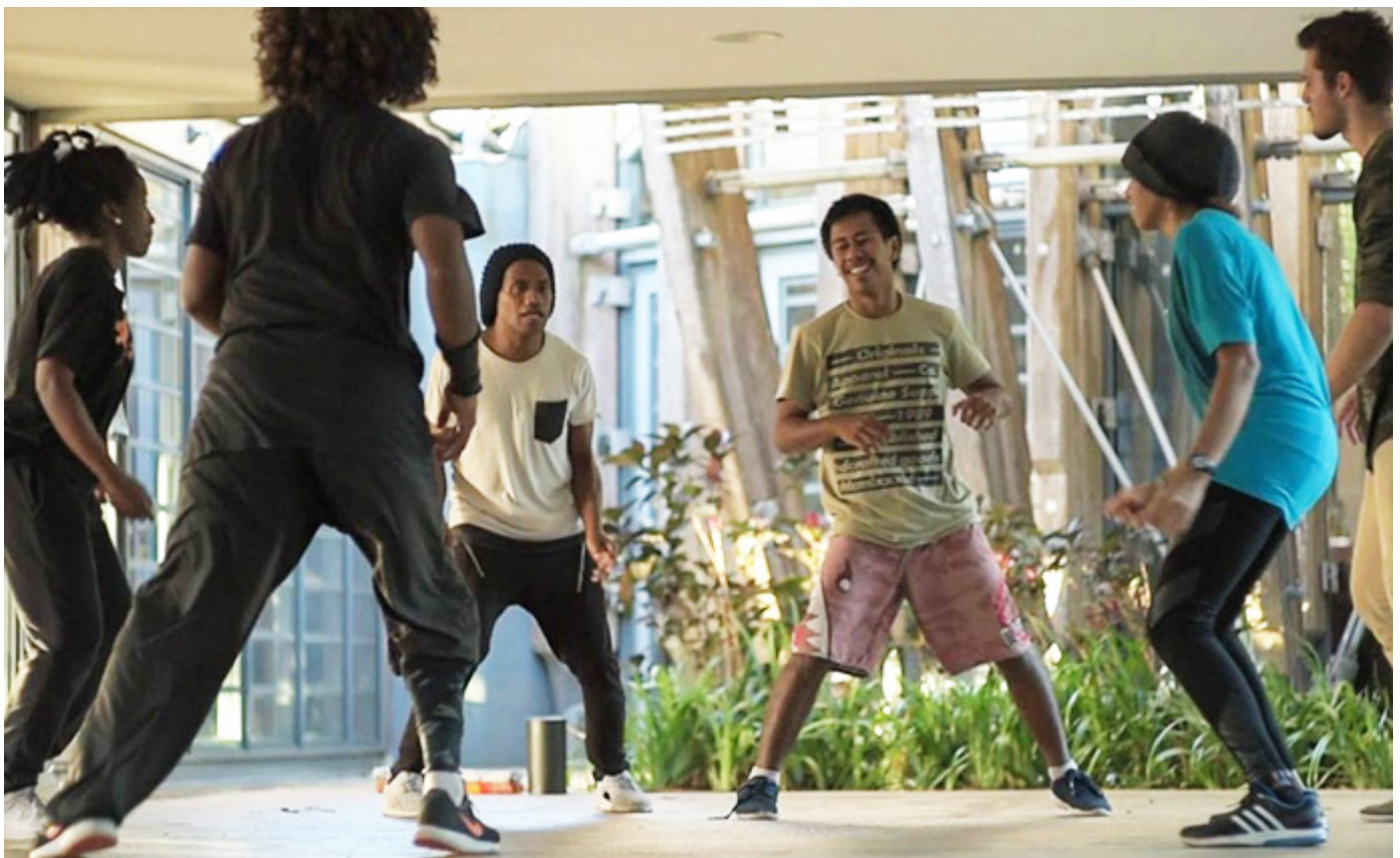
Danse, petit chef, danse !, de Eric Michel

Disponible en ligne dès le 22 juillet 2022