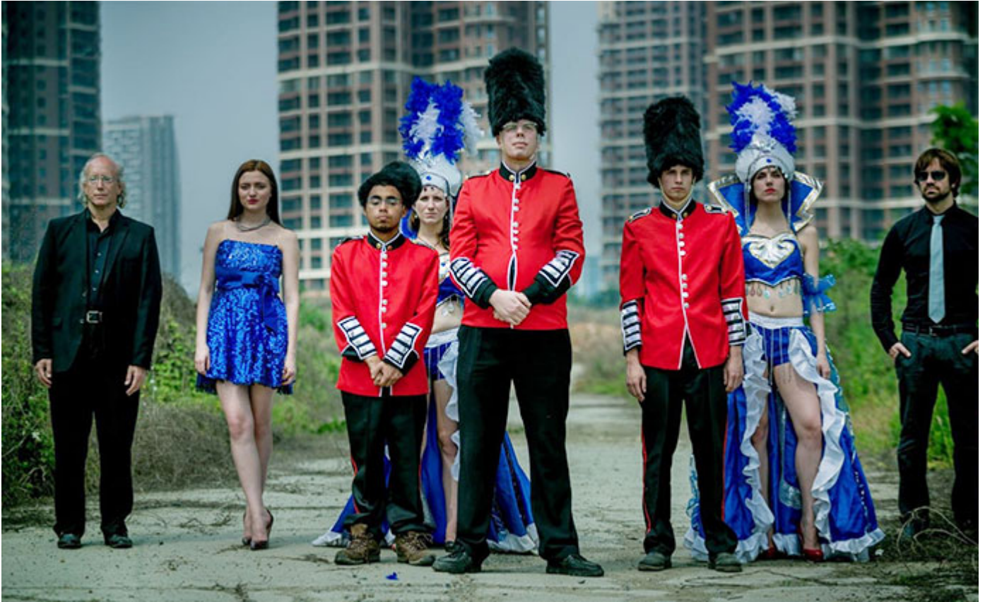
Dream Empire, de David Borenstein

Ce long métrage nous transporte dans l'ouest de la Chine, où l'expansion du marché immobilier de Chongqing attire Yana, une jeune femme de 24 ans. En y voyant la promesse d'une vie prospère, elle ouvre une agence pour fournir des « singes blancs » à des développeurs immobiliers chinois, ces étrangers utilisés pour assister à diverses inaugurations vêtus de costumes et offrant parfois des spectacles minables. Pendant que ce cirque quasi grotesque conçu pour faire état du progrès et de la prospérité du pays bat son plein, Yana lutte pour concilier cette impitoyable absurdité à ses racines rurales.