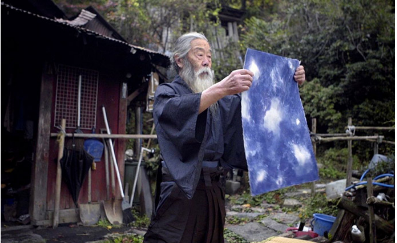
Akeji, le souffle de la montagne de Corentin Leconte et Mélanie Schaan

Dans le fin fond des montagnes, au cœur de la vallée d'Himuro, Akeji et sa compagne Asako vivent à l'écart du monde. Dans un ermitage au toit d'herbe, parmi les animaux et les esprits de la nature, la vie s'écoule dans un espace-temps illimité. Artiste de renom, Maître Akeji descend d'une lignée de samouraïs, initié à l'art sacré du thé, du sabre et de la calligraphie. Ce film contemplatif fait appel aux sens, rythmé par les éléments – l'eau, le feu, la terre et le vent –, et par le cycle des saisons et le temps, thèmes fondamentaux de la pensée japonaise. Cette fabuleuse immersion dans le monde d'un artiste en totale fusion avec la nature souligne poétiquement le cycle de la vie.