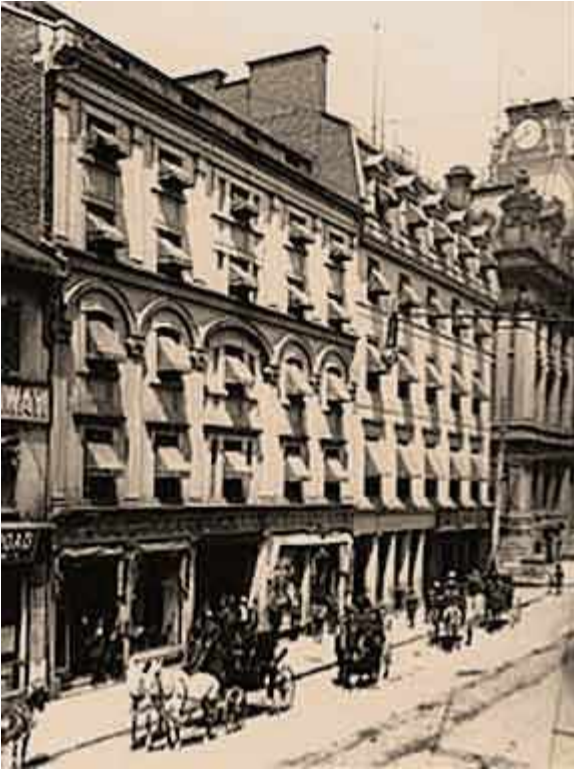
St. Lawrence Hall McCord Museum VIEW-1876

« Cet hôtel de première classe (le plus grand de Montréal) est situé sur la rue Saint-Jacques, à proximité immédiate de la cathédrale française, également appelée église Ville Marie, de la rue Notre-Dame, du bureau de poste, de la Place d'Armes et des grandes banques. Le St. Lawrence Hall est depuis longtemps considéré comme l'hôtel le plus populaire et le plus à la mode de Montréal. Il est fréquenté par les membres du gouvernement à toutes les occasions publiques, y compris lors de la visite de Son Altesse Royale le Prince de Galles et sa suite, et de celle de Son Excellence le Gouverneur général et sa suite... Toutes les chambres sont éclairées au gaz. Le bureau du consulat des États-Unis se trouve dans l'hôtel, ainsi que le bureau du télégraphe. »