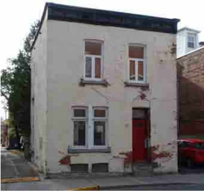
148, avenue Abbott