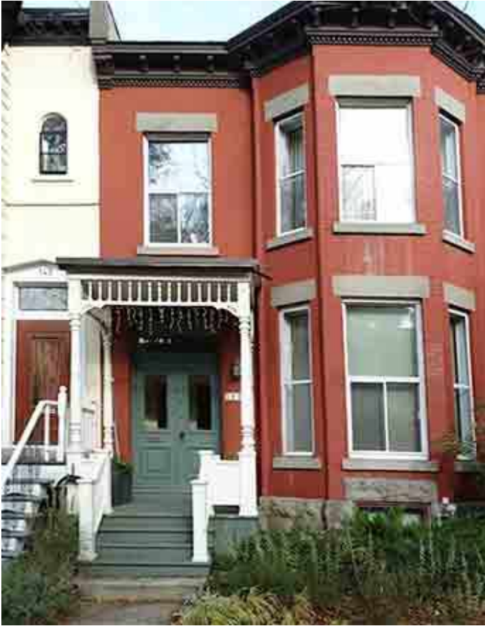
139, avenue Abbott