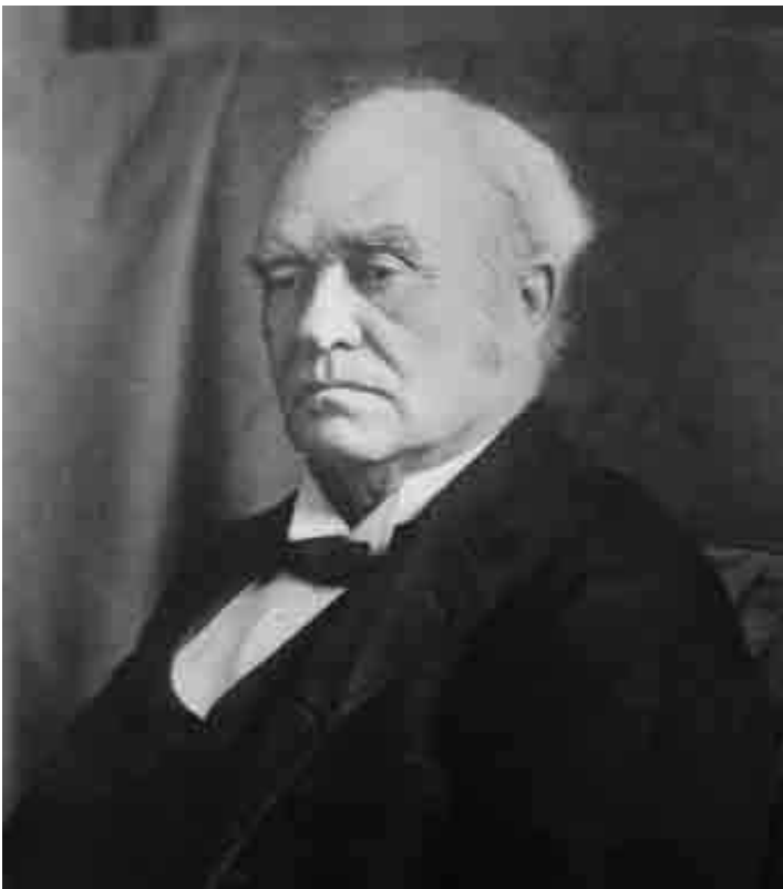
Sir John Joseph Caldwell Abbott

En se promenant dans Westmount, on ne peut s'empêcher d'apprécier les différentes rues sans issue présentes