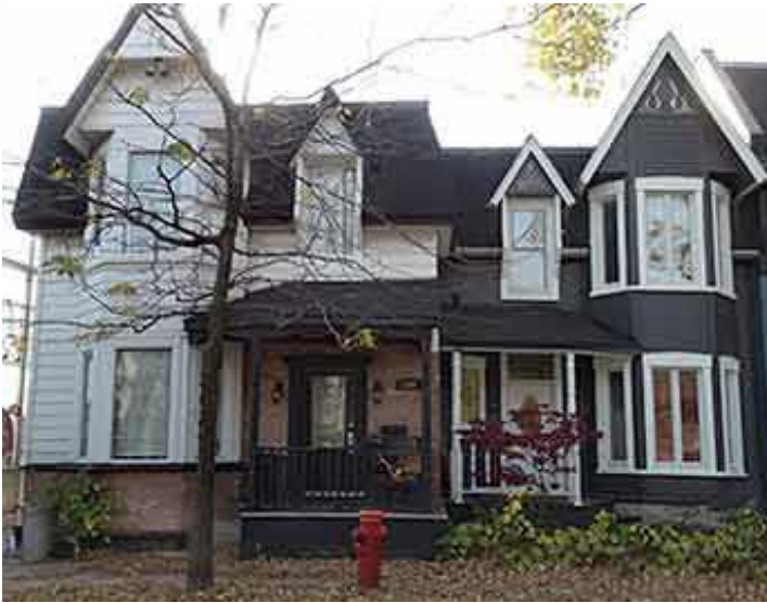
104 et 106, avenue Abbott

C'est toujours un peu difficile d'associer un nom de rue ou d'avenue à un événement ou un individu spécifique. Les procès-verbaux du conseil municipal de cette époque fournissent rarement les raisons pour lesquelles les rues de la ville ont été nommées ou renommées. Cependant, avec l'aide du service de gestion de la documentation et des archives de la ville de Westmount, j'ai été informé que le nom de l'avenue est apparu pour la première fois sur leurs listes d'évaluation en 1820. Avant cette date, seuls les numéros cadastraux étaient inscrits.