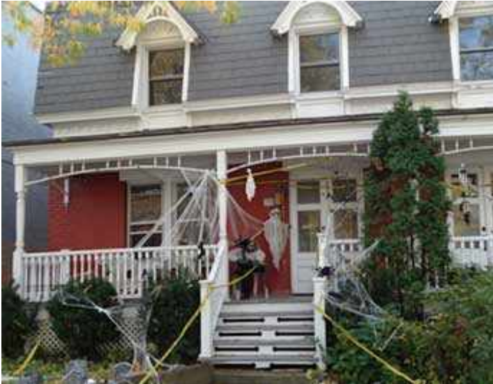
126, avenue Abbott

Maintenant que ce mystère est derrière nous, continuons notre promenade d'automne sur l'avenue Abbott et découvrons l'histoires de certains anciens habitants de ce quartier :