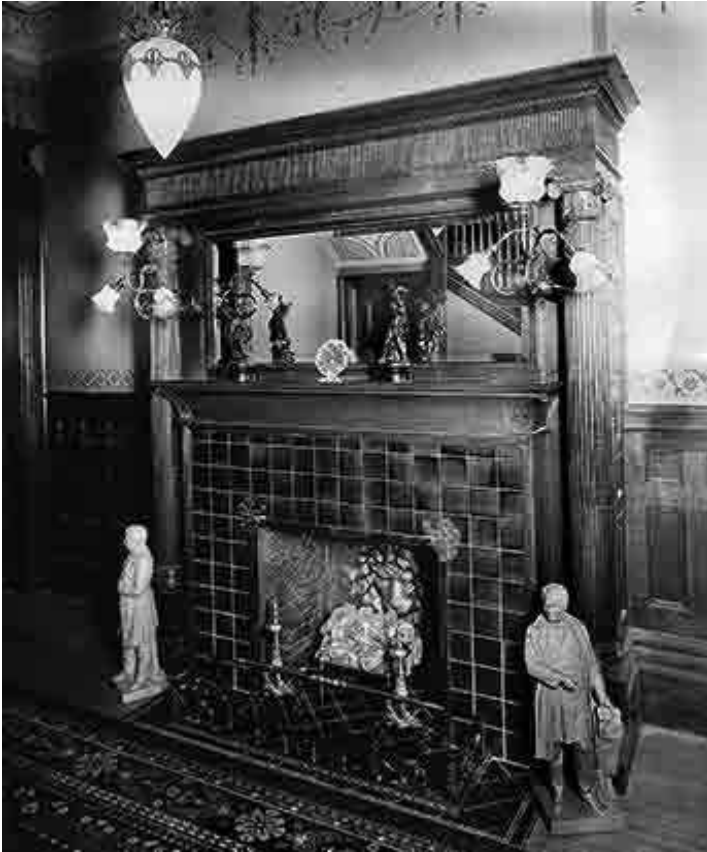
Manteau de cheminée – Webster Bros. & Parkes, Montréal, QC, 1895 – Musée McCord N-II-112983