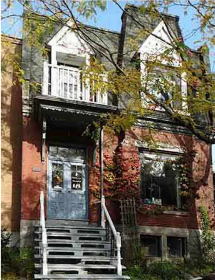
127, avenue Abbott