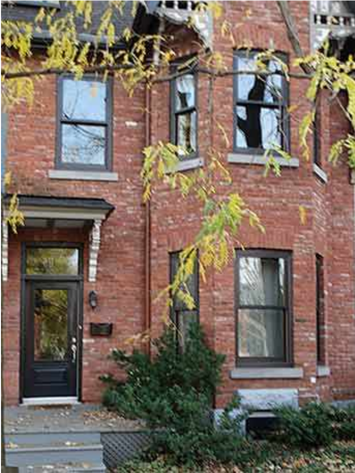
110, avenue Abbott

D'autre part, Sir John Joseph Caldwell Abbott était le troisième Premier ministre du Canada (1891-1892) – à l'époque même de la première utilisation du nom de l'avenue. On peut donc supposer sans risque que le conseil municipal a approuvé le nom de l'avenue en son honneur.