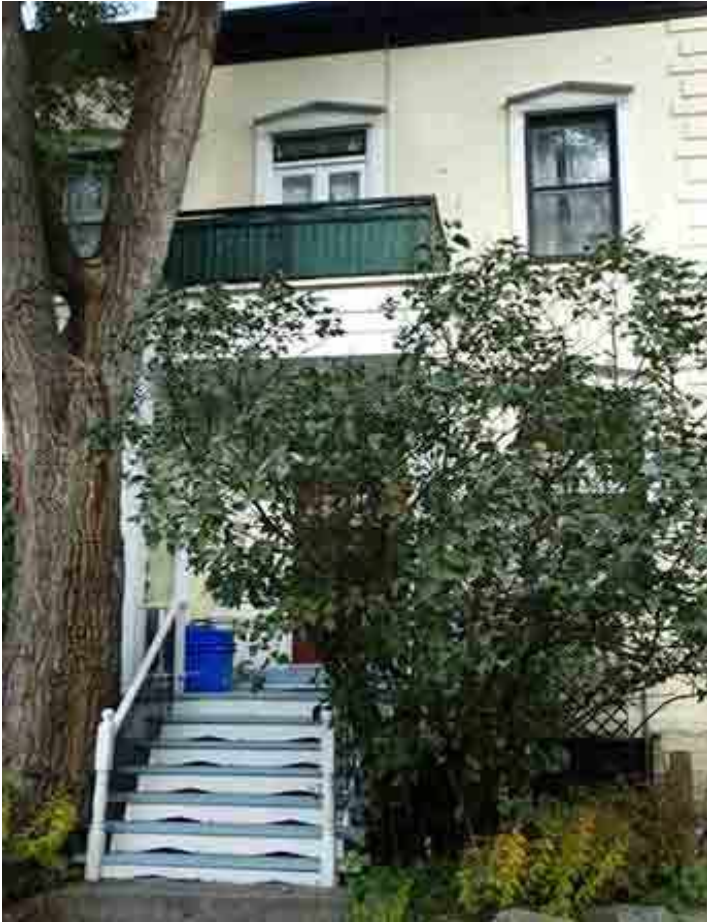
147, avenue Abbott