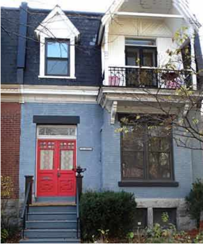
120, avenue Abbott

Pour ajouter encore à la confusion, les images de l'ancienne station Abbott sont référencées de manière incohérente avec celles de la station Victoria, agrandie à deux reprises dans les années 1920 et apparaissant sous différentes formes selon la période.