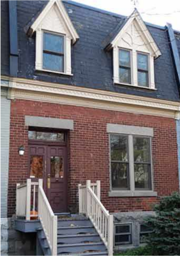
116, avenue Abbott