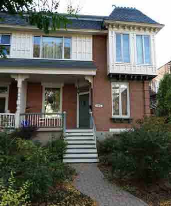
142, avenue Abbott