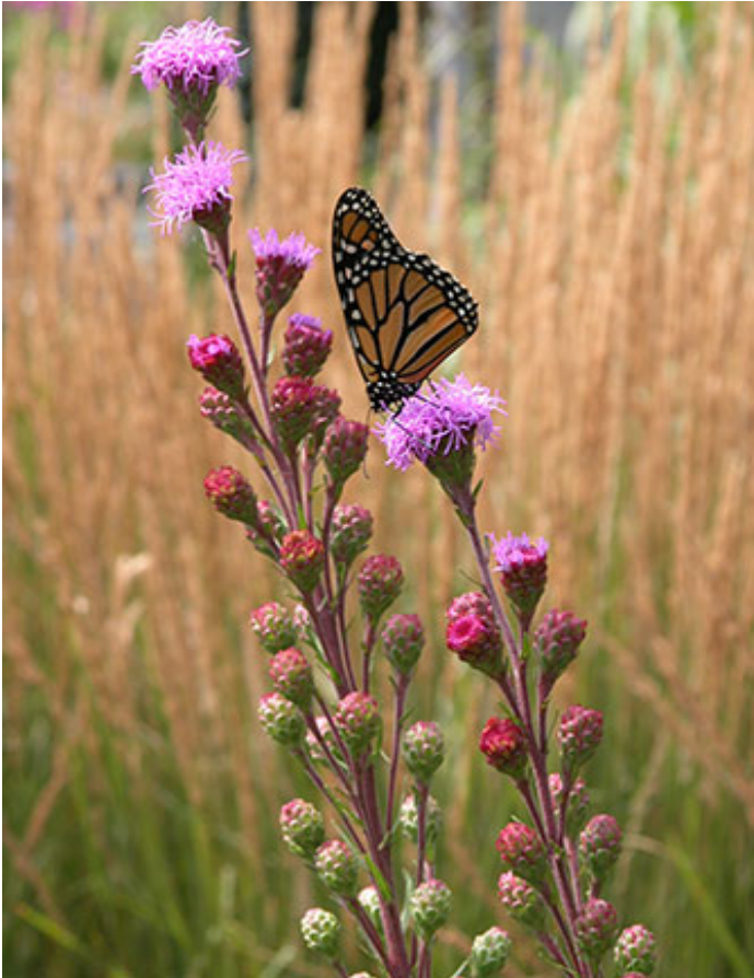
Monarque sur danaus plexippus