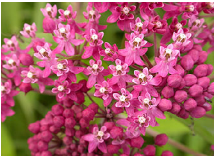
Asclepias incarnata