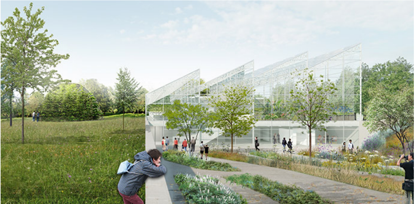
Parvis extérieur – Image: Kuehn Malvezzi

De plus, alors que les plantes feront tranquillement leur place tout au long de l'été dans le Jardin des pollinisateurs, des animateurs et animatrices scientifiques accompagneront le public dans leurs découvertes. Des découvertes qui pourraient bien donner envie d'en faire plus pour ces précieux pollinisateurs.