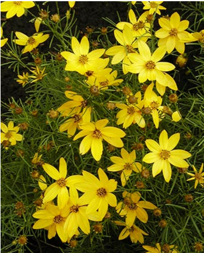
Coreopsis verticillata

Premier musée en Amérique du Nord où il est possible d'observer autant d'espèces d'insectes – vivants (dont certains en liberté) et naturalisés – en un seul lieu, l'Insectarium convie ses visiteurs et visiteuses à une rencontre hors de l'ordinaire avec les insectes.